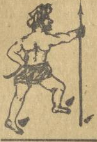
Appandjoenggal songon bortoeng

Noenga manombo moese lagak ni Appandjoenggal, ndada mardolos pitolonna. badjoena dohot takoeleokna katja mata na songon laklak ni djoring i pe noenga dioelakkon dilangkophon to matana. Sian na dao pe tinatap App. boeaton ni bodil manigor marbolalak do songon bortoeng.